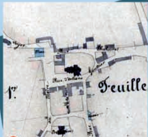
4 Mare d'eau disparue vers 1960