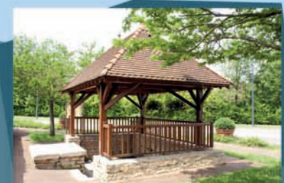
8 Le lavoir de la rue de Sully