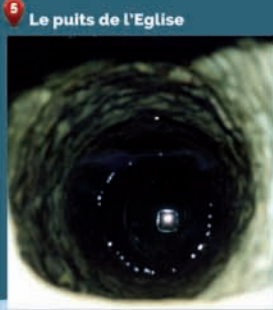
5 Le puits de l'Eglise