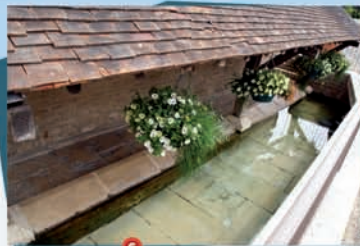
6 Le lavoir de la rue Gauthier