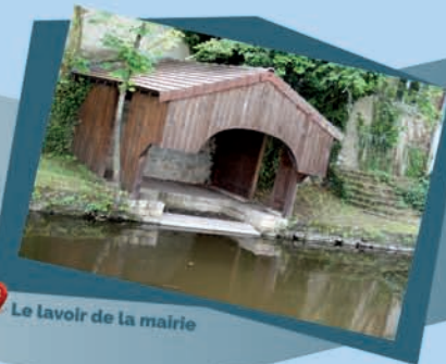
2 Le lavoir de la mairie