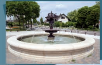
3 La fontaine du square Emile Pigeon