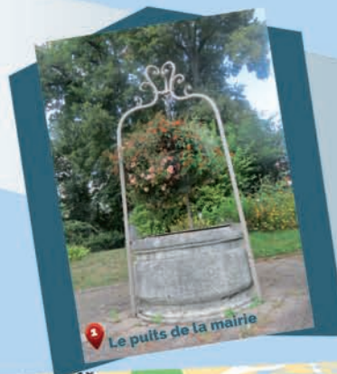
1 Le puits de la mairie

Descendre la rue du 11 septembre 1944. Traverser la rue Claude Martin, faire le tour des douves jusqu'au lavoir. Prendre la rue de Moirey en direction du lavoir de Sully. Arrêt à la fontaine. Arriver au lavoir de Sully. Remonter la rue de Sully, (la ferme Martin.) Prendre le cours de Gray jusqu'à l'impasse du Jura. Descendre l'impasse, prendre la rue de Moirey jusqu'à la mairie.