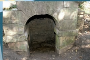
7 L'entrée de la glacière du clos Saint-François