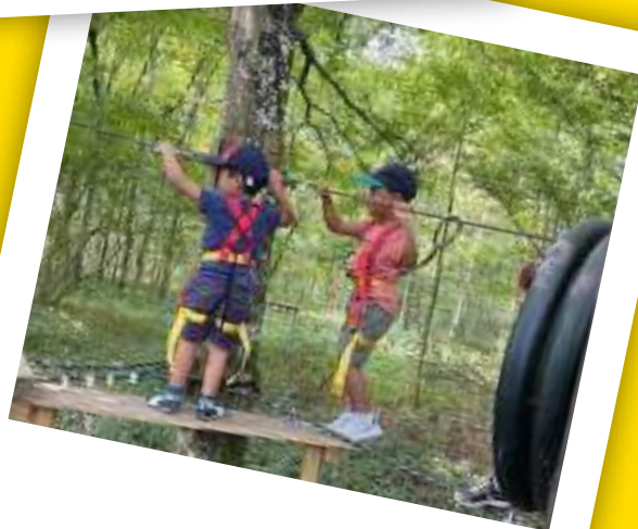
Question de confiance et d'équilibre...