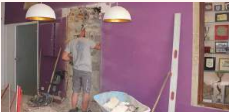
Parallèlement, des réaménagements intérieurs ont été menés. Ici l'accueil (Juillet 2022)