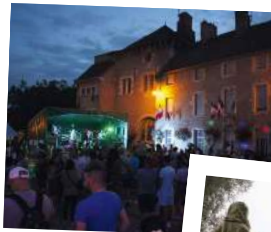
La foule était au rendez-vous pour le concert et le feu d'artifice du 13 juillet