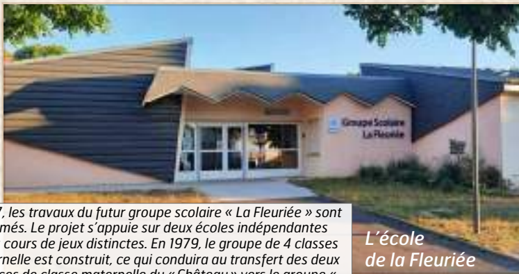
L'école de la Fleuriee

Ce groupe scolaire a accueilli jusqu'à 320 élèves dans les années 1970. A ce jour, 250 élèves le fréquentent encore. À court terme ce groupe scolaire est amené à être fermé pour être remplacé par une école plus moderne dans le quartier du pré Thomas.