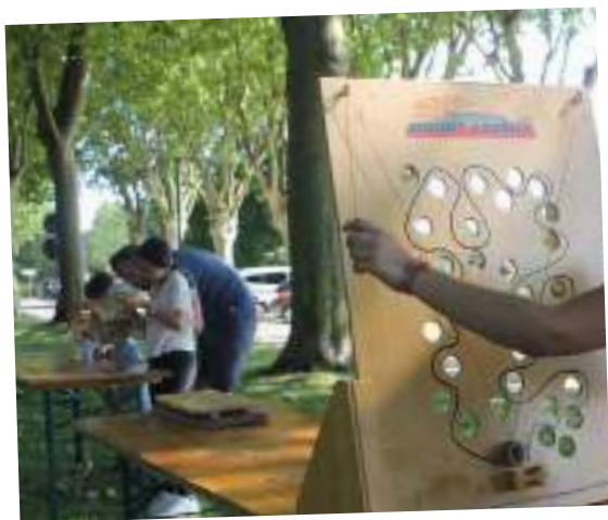
Autre rendez-vous de Médi@ludo, les grands jeux sous les arbres