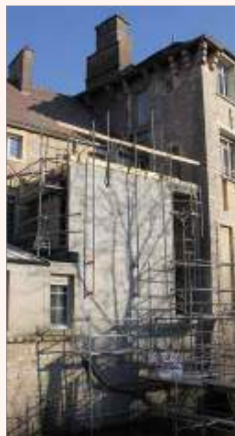
La nouvelle tour prend forme (Février-mars 2021)