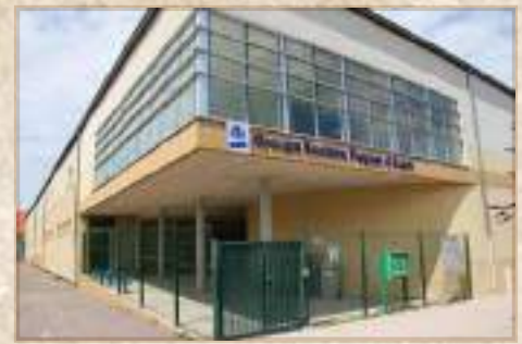
L'école du Pâquier d'Aupré

Les nouveaux quartiers Abbé-Pierre, Noyer pendu, ... nécessitent dans les années 1970 l'ouverture d'un nouveau groupe scolaire : « Les Lilas ». Cet ensemble a d'abord été transformé en centre de loisirs avant d'être remplacé par des immeubles d'habitation.