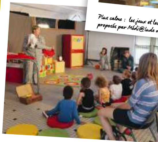
Plusieurs spectacles pour enfants étaient au programme. Ici, « La malle aux impros »