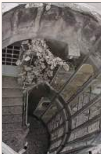
Début des travaux de démolition (Août 2021)