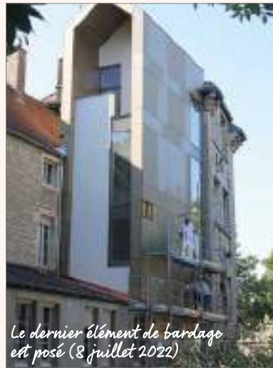
Le dernier élément de bardage est posé (8 juillet 2022)