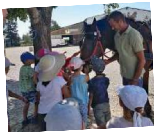
Les chevaux ont toujours la faveur des enfants