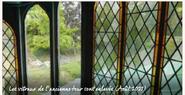
Les vitraux de l'ancienne tour sont enlevés (Août 2021)