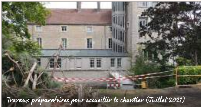
Travaux préparatoires pour accueillir le chantier (Juillet 2021)

Retour en 12 images sur les principales étapes de ces travaux rendus nécessaires par la vétusté de l'ancienne tour et obligatoires par la loi sur l'accessibilité des établissements recevant du public (ERP).