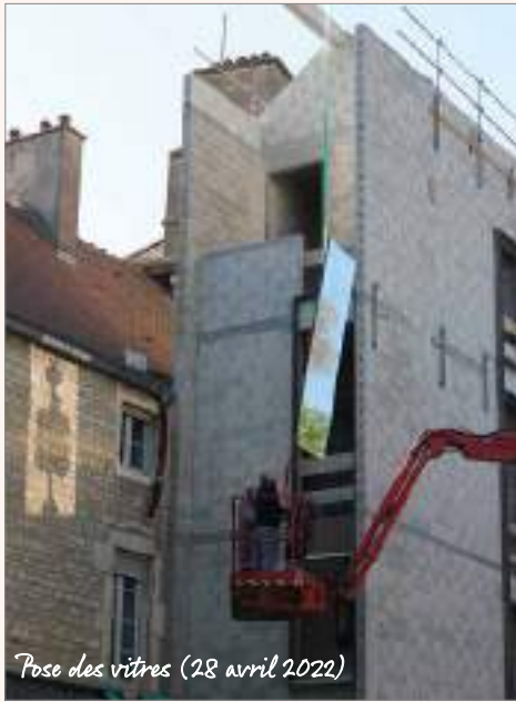
Pose des vitres (28 avril 2022)