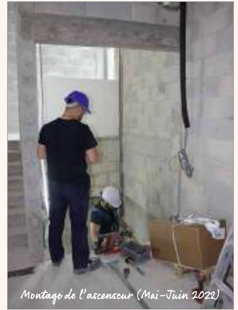
Montage de l'ascenseur (Mai-Juin 2022)