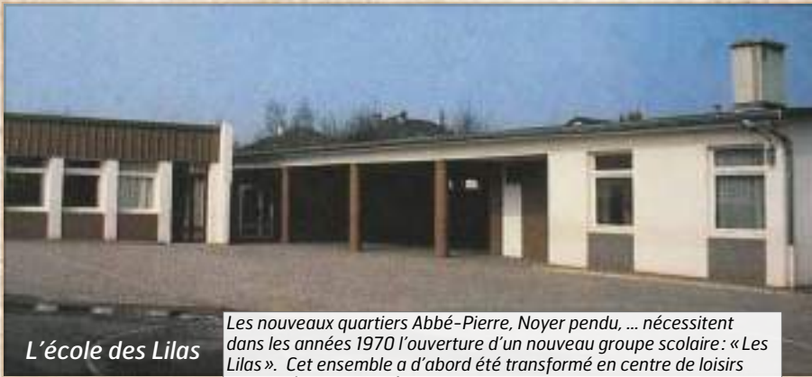
L'école des Lilas

Les nouveaux quartiers Abbé-Pierre, Noyer pendu, ... nécessitent dans les années 1970 l'ouverture d'un nouveau groupe scolaire : « Les Lilas ». Cet ensemble a d'abord été transformé en centre de loisirs avant d'être remplacé par des immeubles d'habitation.