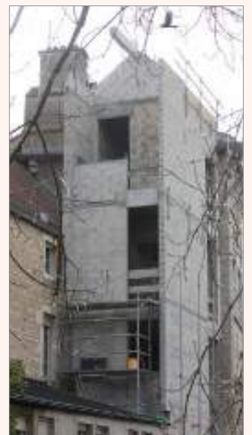
Le façage est posé (7 avril 2022)