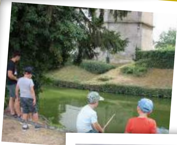
Pêche dans les douves dans le cadre de l'ALSH