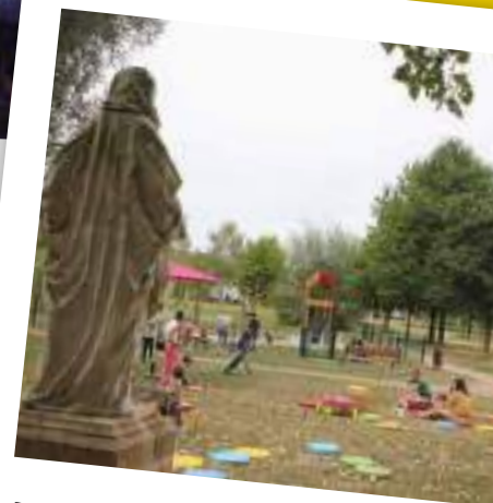
Plus calme : les jeux et lectures sous parasols, proposés par Médi@ludo durant tout le mois de juillet