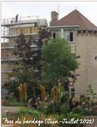
Pose du bardage (Juin-Juillet 2022)