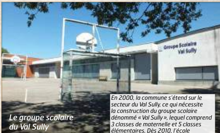
Le groupe scolaire du Val Sully

Ces locaux se substituent aux locaux préfabriqués de l'école « Le Bourg ». L'école accueille aujourd'hui 200 élèves.