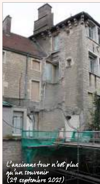
L'ancienne tour n'est plus qu'un souvenir (29 septembre 2021)