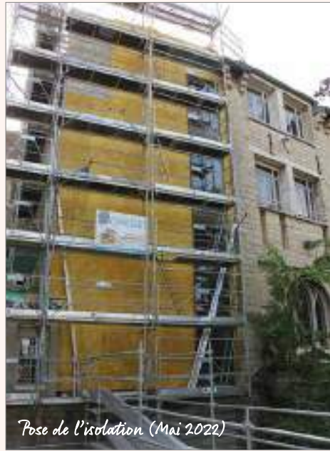
Pose de l'isolation (Mai 2022)