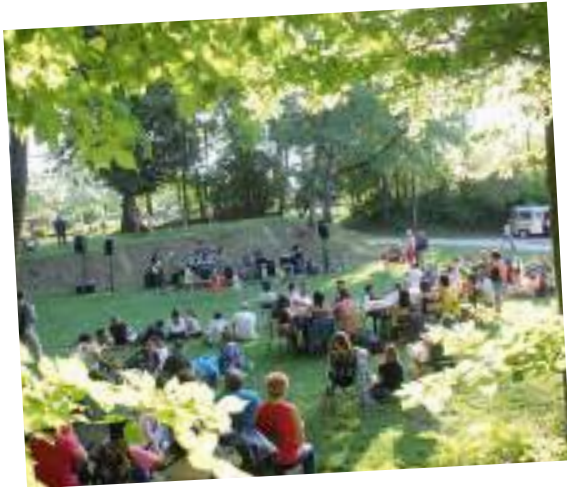
Après Fover, dès le 1 er juillet, c'est Fover Young qui fait monter la fièvre le 5 juillet

CONCERTS, SPECTACLES, DÉCOUVERTES, ACTIVITÉS PHYSIQUES... LES PROPOSITIONS N'ONT PAS MANQUÉ POUR PASSER UN BEL ÉTÉ À SAINT-APOLLINAIRE. PETIT RETOUR EN IMAGES SUR QUELQUES-UNS DE CES RENDEZ-VOUS.