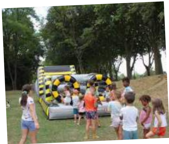
Les structures gonflables étaient de sorties les 25, 26 et 27 juillet

SORTIES À PARIS POUR LA JAPAN EXPO, ACCROBRANCHES OU ENCORE VISITE DE CHÂTEAUNEUF, ÉTAIENT AU MENU DE L'ESPACE JEUNES. L'ALSH A PROPOSÉ POUR SA PART DES SORTIES VÉLOS, DU CHEVAL OU ENCORE DES ACTIVITÉS MANUELLES. À NOTER QU'AVEC UNE MOYENNE DE 94 ENFANTS PAR JOUR EN JUILLET (263 INSCRITS) ET 73 EN AOÛT (231 INSCRITS), L'ALSH A RETROUVÉ SA FRÉQUENTATION D'AVANT LA CRISE SANITAIRE.