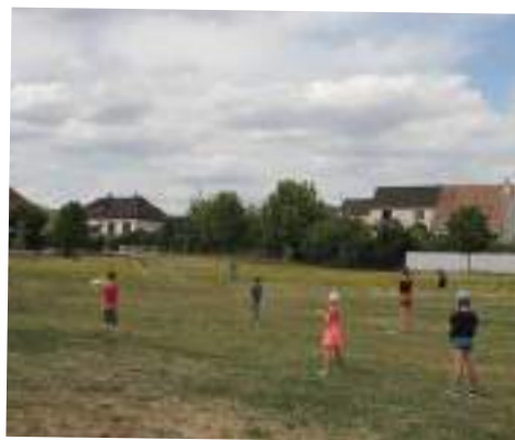
Activité ultime avec le service des sports